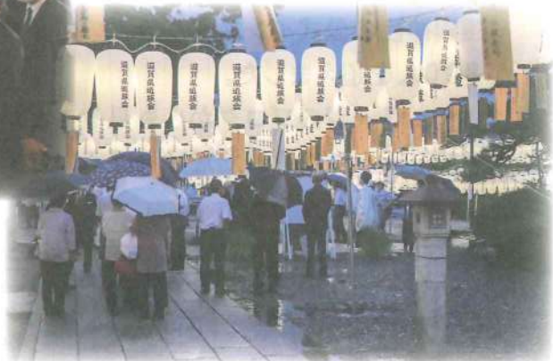
雨の中点灯式に立ち会う参拝者