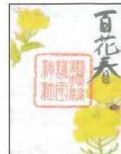
てんとう虫と菜の花