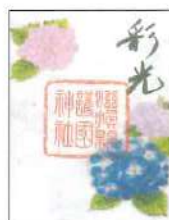
紫陽花とカタツムリ