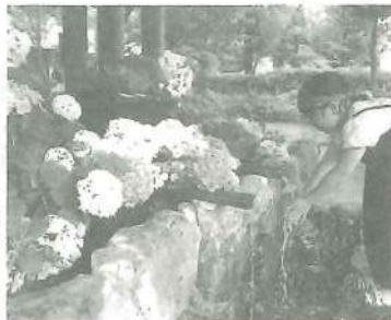
アジサイの花手水で手を洗う女の子

護国神社 手作り茅の輪設置 「コロナ収束」願い 4日まで 彦根市尾末町の滋賀県護国神社は30日に、夏越の大祓に合わせて、茅の輪を拝殿前に設置した。26日に準備していた金 「護国神社は新型コロナウイルスの終息を願って昨年からは茅の輪作りを計画し、職たちが近江八幡市で約1000個を収穫し、軽トラで彦根まで運