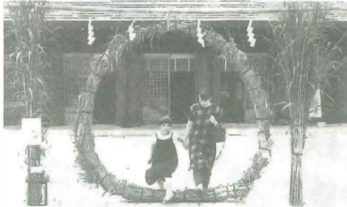
県護国神社拝殿前に設置された茅の輪をくぐる親子連れ

護国神社 手作り茅の輪設置 「コロナ収束」願い 4日まで 彦根市尾末町の滋賀県護国神社は30日に、夏越の大祓に合わせて、茅の輪を拝殿前に設置した。26日に準備していた金 「護国神社は新型コロナウイルスの終息を願って昨年からは茅の輪作りを計画し、職たちが近江八幡市で約1000個を収穫し、軽トラで彦根まで運